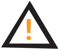
Accidente con Potencial LGF